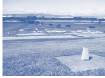
摂津市 淀川をはじめ、3本の川に囲まれた古くから農耕が盛んな街。高い位置を走るモノレールからの遠景は特別な美しさ。