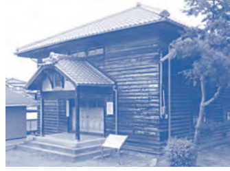
旧一津屋公会堂 1913年(大正2年)に地元の農家など、160世帯が出資して建てられた、かつての娯楽の殿堂。