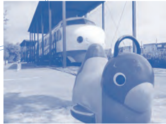
新幹線公園 新幹線先頭車両0系と戦後の代表的機関車EF15型が展示されている。春には桜がトンネル状に咲く。